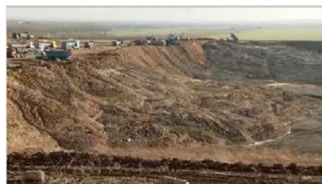
Une vue du chantier

« Les Yeux du Ciel » sont situés à Villeneuve-sous-Dammartin dans l'axe des pistes d'atterrissage et de décollage de Roissy CDG sur un plateau de 1 600 mètres de longueur par 800 de large et 30 mètres de hauteur.