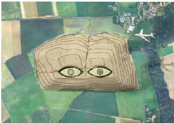
Le projet de land art, entre « art métropolitain » et « art aérien », mis en œuvre par ECT et imaginé par l'architecte-urbaniste Antoine Grumbach, s'étend sur 130 ha. ©Antoine Grumbach

Ce projet de land art, entre « art métropolitain » et « art aérien », mis en œuvre par ECT et imaginé par l'architecte-urbaniste Antoine Grumbach, s'étend sur 130 ha, enneigés ce jour-là, situés dans l'axe des pistes de l'aéroport Roissy-Charles-de-Gaulle. Cet immense projet de réaménagement rural, rythmé par le balai des camions et le survol des avions, entend devenir la vitrine des Jeux olympiques et paralympiques de Paris 2024 en même temps qu'un « grand lieu de loisir », comme l'a rappelé Antoine Grumbach, lors du lancement du projet, vendredi 25 janvier 2019 (*).