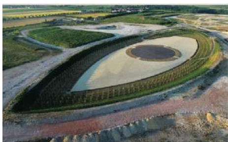
Vue aérienne de l'œil ICARE

« Les Yeux du Ciel » est un projet de Land Art conçu par l'artiste architecte urbaniste Antoine Grumbach et soutenu par la société ECT .