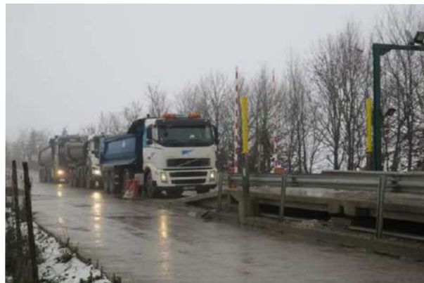
Si la terre et les gravats sont issus de tous les chantiers de l'Île de France, 20 à 25% des déchets proviendront de la Société du Grand Paris (SGP) au pic des chantiers.

Si la terre et les gravats sont issus de toute l'Île de France, 20 à 25 % des déchets proviendront de la Société du Grand Paris (SGP) au pic des chantiers, contre 10 % aujourd'hui ». souligne Laurent Mogno. Un pic qui correspond aux chantiers des lignes livrées pour 2024, soit entre 2019 et 2022, durant lesquelles l'ensemble des tunneliers du Grand Paris express (21 au total) fonctionneront en même temps, rappellent les dirigeants d'ECT. Avec une cadence qui va s'accroître, pour respecter les délais et des tunneliers du Grand Paris Express qui vont œuvrer 24 heures sur 24. ECT s'est assurée de pouvoir recevoir les gravats la nuit. Au total, le Grand Paris représente 43 millions de tonnes de matériel à réutiliser ou réaménager. Des terres excavées présentant des particularités adaptées à l'édifice.