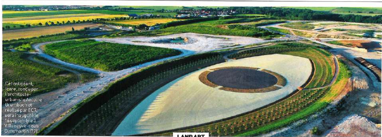
Cet œil géant, Icare , conçu par l'architecte-urbaniste Antoine Grumbach et réalisé par ECT, sera inauguré le 16 septembre à Villeneuve-sous-Dammartin (77).

Ouverture de la Maison Gainsbourg, choix du mobilier pour Notre-Dame ou bonnes idées pour profiter des journées du Patrimoine, l'actualité de l'art de la culture est dans L'Œil .