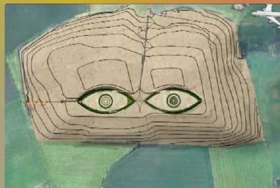
Les Yeux du Ciel, une oeuvre monumentale imaginée par l'architecte Antoine Grumbach, sera achevée pour 2024.

Écrit par France 3 Paris IDF / VP avec P.Sorgues