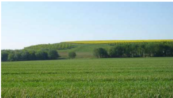
Le site de Villeneuve-sous-Dammartin en été.

« ECT mène au travers de ce projet une recherche écologique et quasiment scientifique pour la préservation et la réintroduction des espèces », a souligné Gilles Chauffour, maire de Villeneuve-sous-Dammartin, qui a rappelé que la ligne 17 du GPE passera à 1 kilomètre du site et du village.