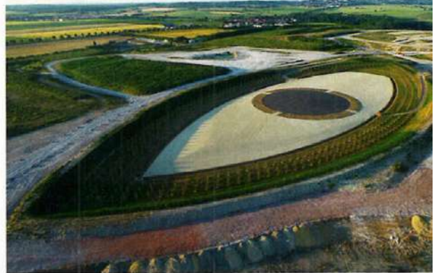
L'Œil du ciel, réalisé par EGT à Villeneuve-sous-Dammartin, France © EGT mai 2023, Courtesy Jeanne Bucher Jaeger, Paris-Lisbonne.

examine la mémoire des hommes tout comme son empreinte dans l'environnement, Les Yeux du Ciel se prolonge à la galerie Jeanne Bucher Jaeger où maquettes, sculptures, dessins, films et photographies